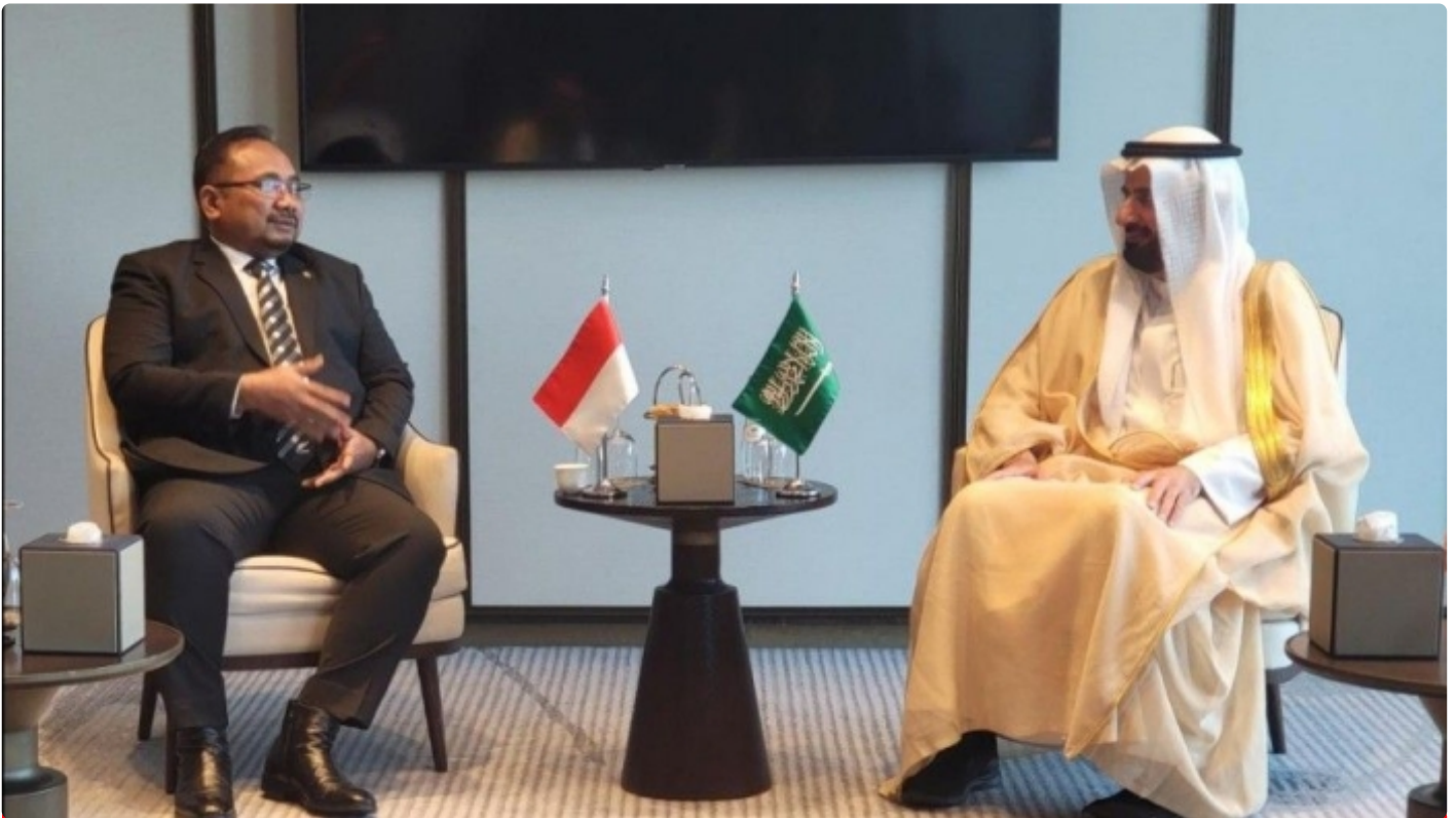
Menag Yaqut bertemu Menteri Haji Arab Saudi Tawfiq F. Al Rabiah, di Jeddah.

JAKARTA - Indonesia dan Pemerintah Kerajaan Arab Saudi telah menandatangani kesepakatan penyelenggaraan ibadah haji 1444 H/2023 M. Kesepakatan tersebut ditandatangani hari ini oleh Menag Yaqut Cholil Qoumas bersama Menteri Haji dan Umrah Arab Saudi Tawfiq F Al Rabiah di Jeddah.