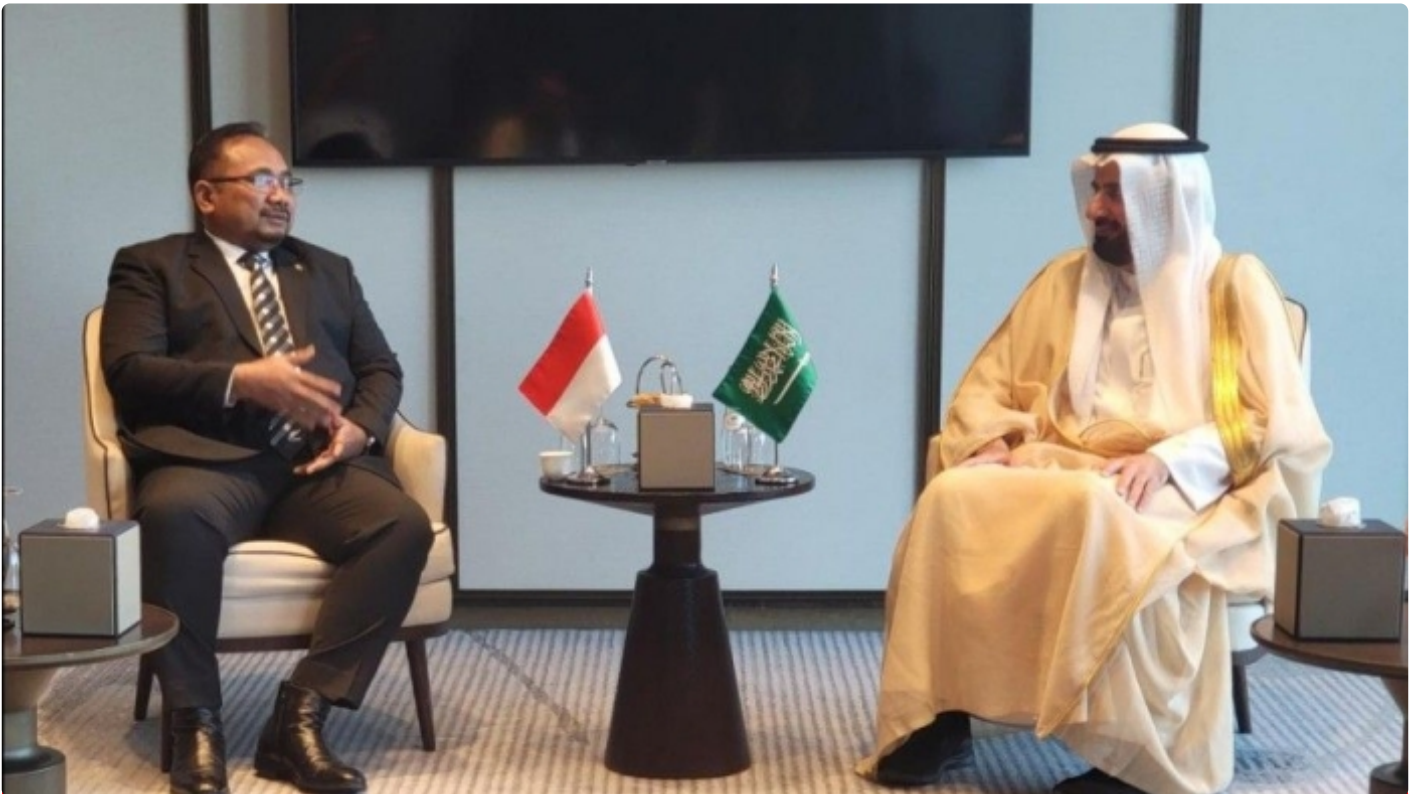
Menag Yaqut bertemu Menteri Haji Arab Saudi Tawfiq F. Al Rabiah, di Jeddah.

JAKARTA - Indonesia dan Pemerintah Kerajaan Arab Saudi telah menandatangani kesepakatan penyelenggaraan ibadah haji 1444 H/2023 M. Kesepakatan tersebut ditandatangani hari ini oleh Menag Yaqut Cholil Qoumas bersama Menteri Haji dan Umrah Arab Saudi Tawfiq F Al Rabiah di Jeddah.